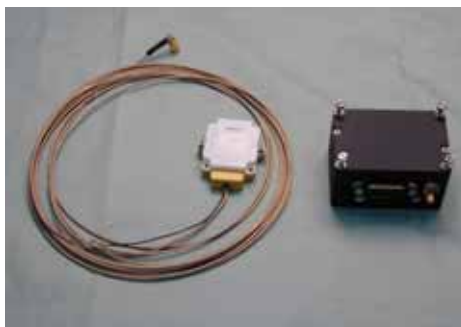
アンテナ (左) および回路部 (右)