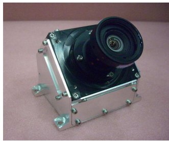
カメラ (広角カメラ)