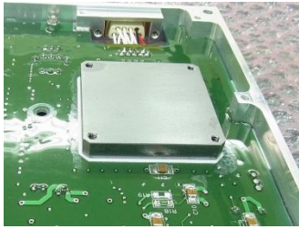
放射線試験結果から軌道上で想定される放射線をシールドするために、Ta(タンタル)でICを保護した事例