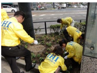
花壇への植栽作業 明星社員:右奥の2名