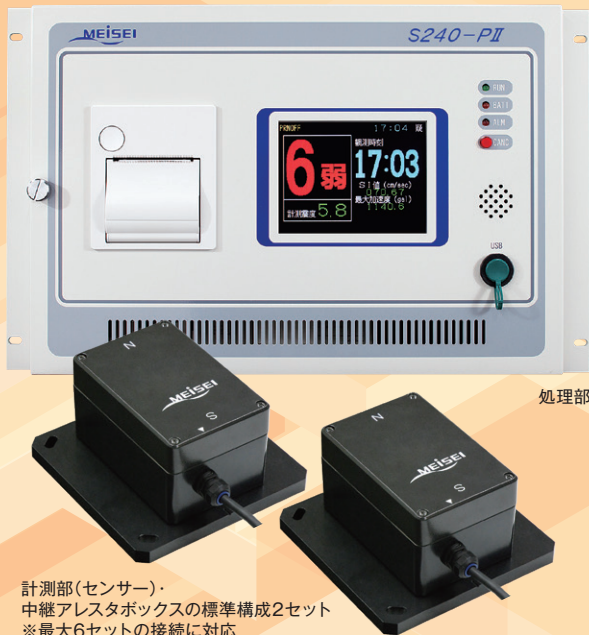
計測部(センサー)・中継アレスタボックスの標準構成2セット ※最大6セットの接続に対応

処理部1台に対して、最大で6台までのセンサーを接続。多チャンネルから計測されるデータを元に、きめ細やかで柔軟な防災システムの構築を実現します。